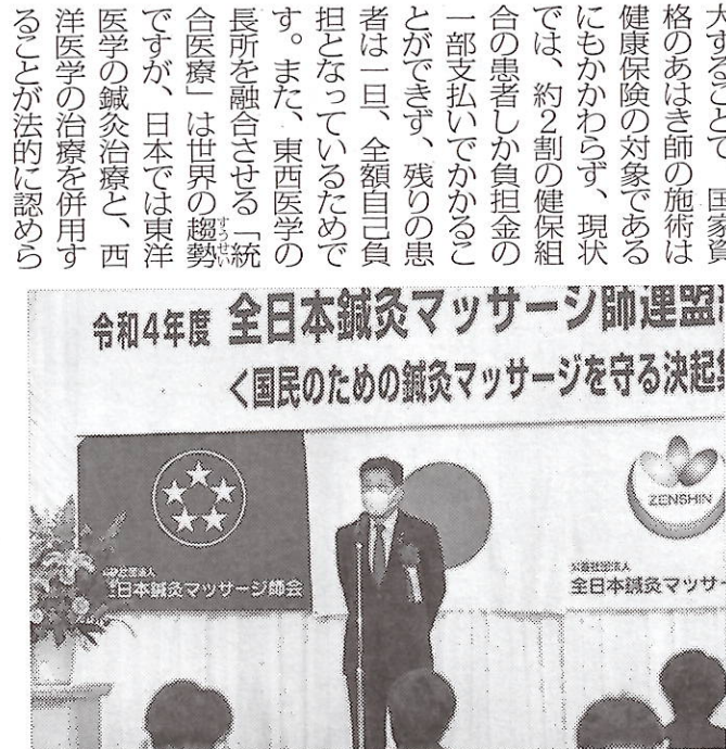
昨年5月、参院選を目前に控える中開催された「全日本鍼灸マッサージ師連盟」総会の様子