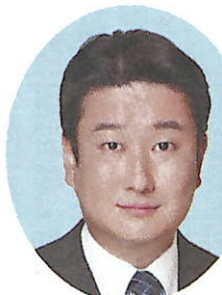
和田 政宗 参院議員